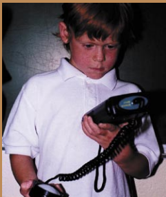
Energie auf der Spur! Workshop, 2003